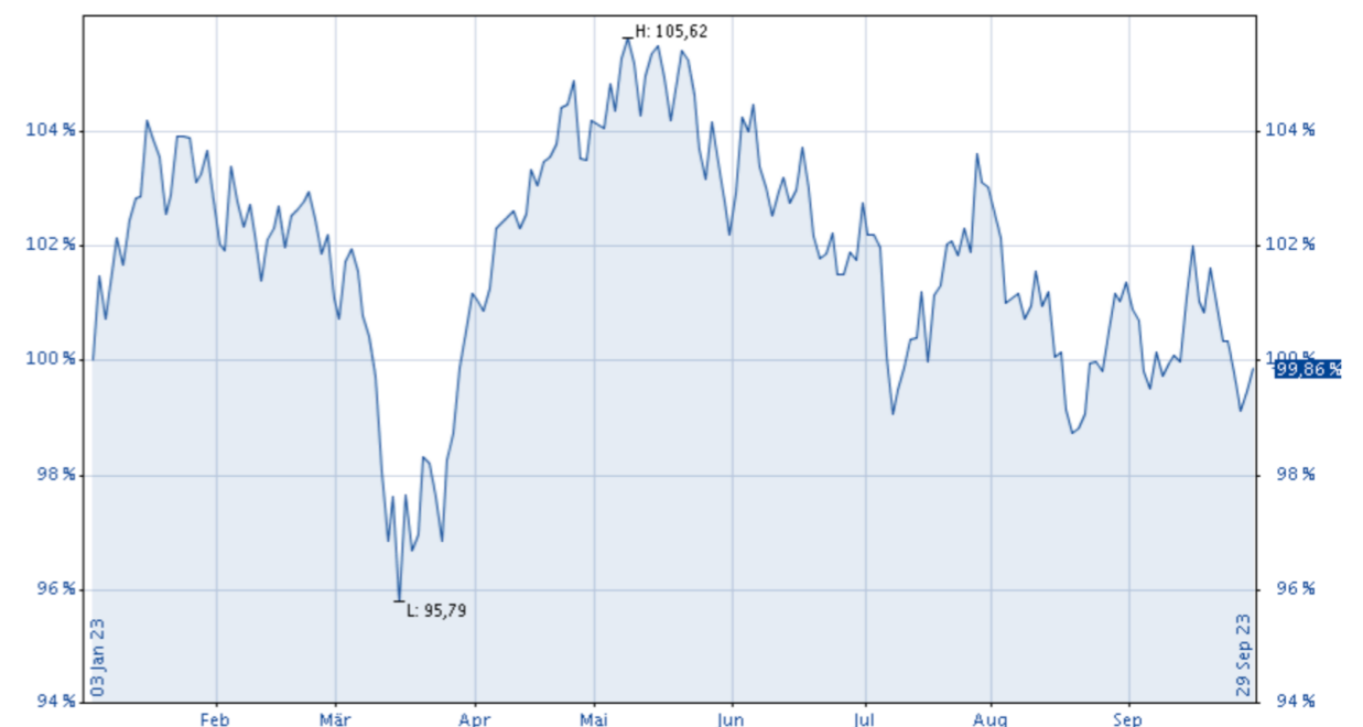
SMI Entwicklung vom 01.01.2023 bis 30.09.2023

Perfomancedaten sind vergangenheitsbezogen und haben keine Aussagekraft für die zukünftige Entwicklung