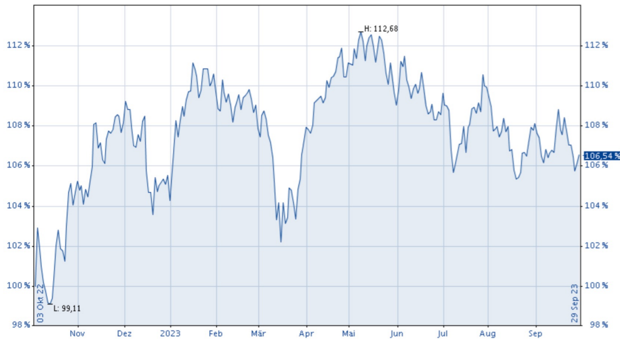
SMI Entwicklung vom 01.10.2022 bis 30.09.2023

Perfomancedaten sind vergangenheitsbezogen und haben keine Aussagekraft für die zukünftige Entwicklung