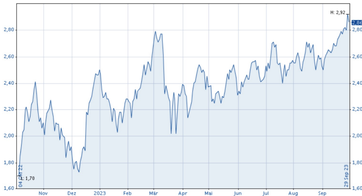
Inflation Entwicklung vom 01.01.2023 bis 30.09.2023