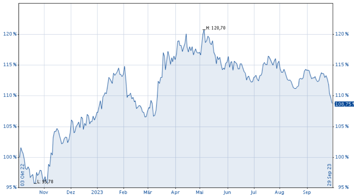
Öl Entwicklung vom 01.10.2022 bis 30.09.2023