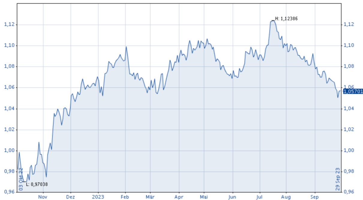
US Dollar Entwicklung vom 01.10.2022 bis 30.09.2023

Performancedaten sind vergangenheitsbezogen und haben keine Aussagekraft für die zukünftige Entwicklung