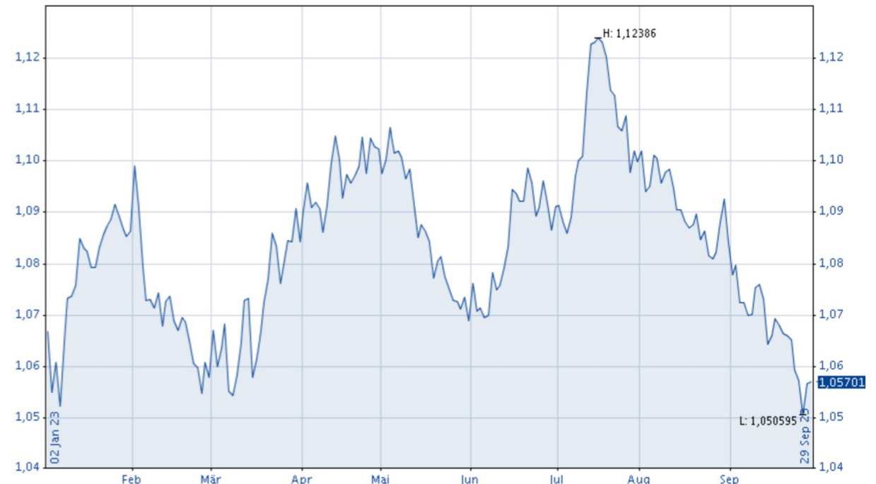
US Dollar Entwicklung vom 01.01.2023 bis 30.09.2023

Performancedaten sind vergangenheitsbezogen und haben keine Aussagekraft für die zukünftige Entwicklung